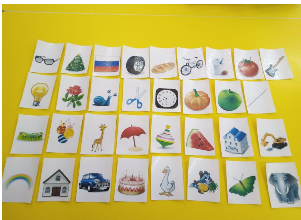
Карточки по количеству согласных и гласных букв в алфавите.